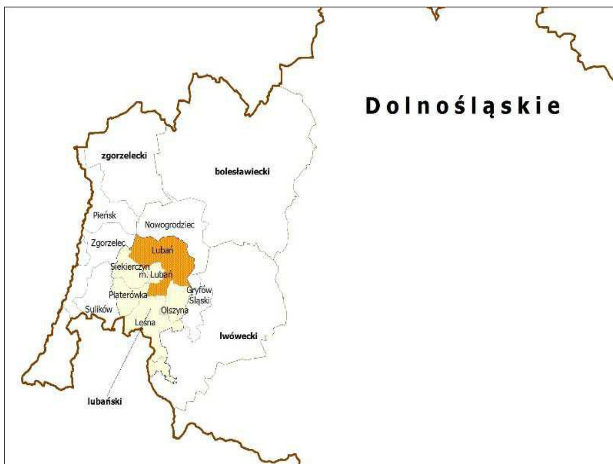
Lokalizacja Gminy Lubań na tle podziału administracyjnego.