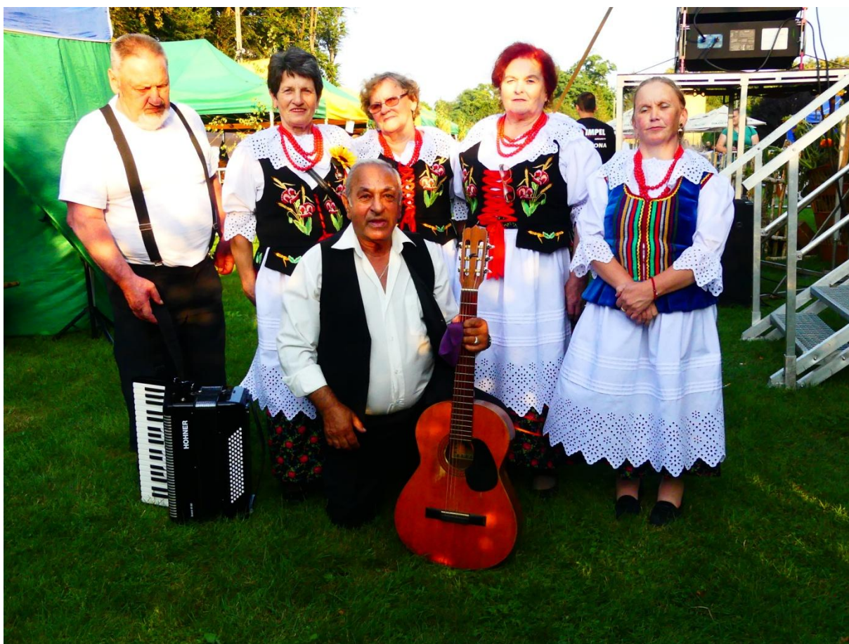
Zespół folklorystyczny Marysieńki.