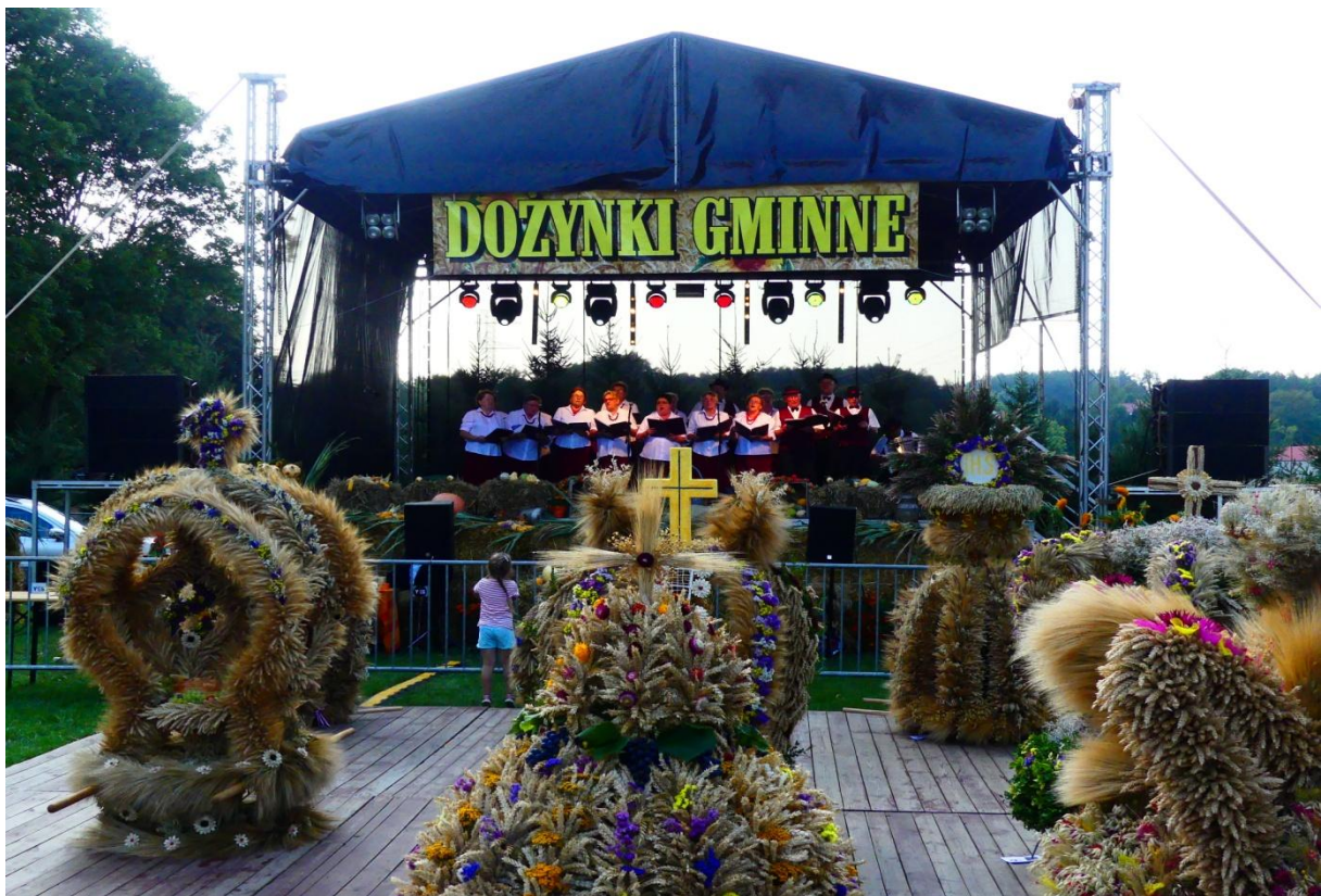
Dożynki Gminne 2019 r.