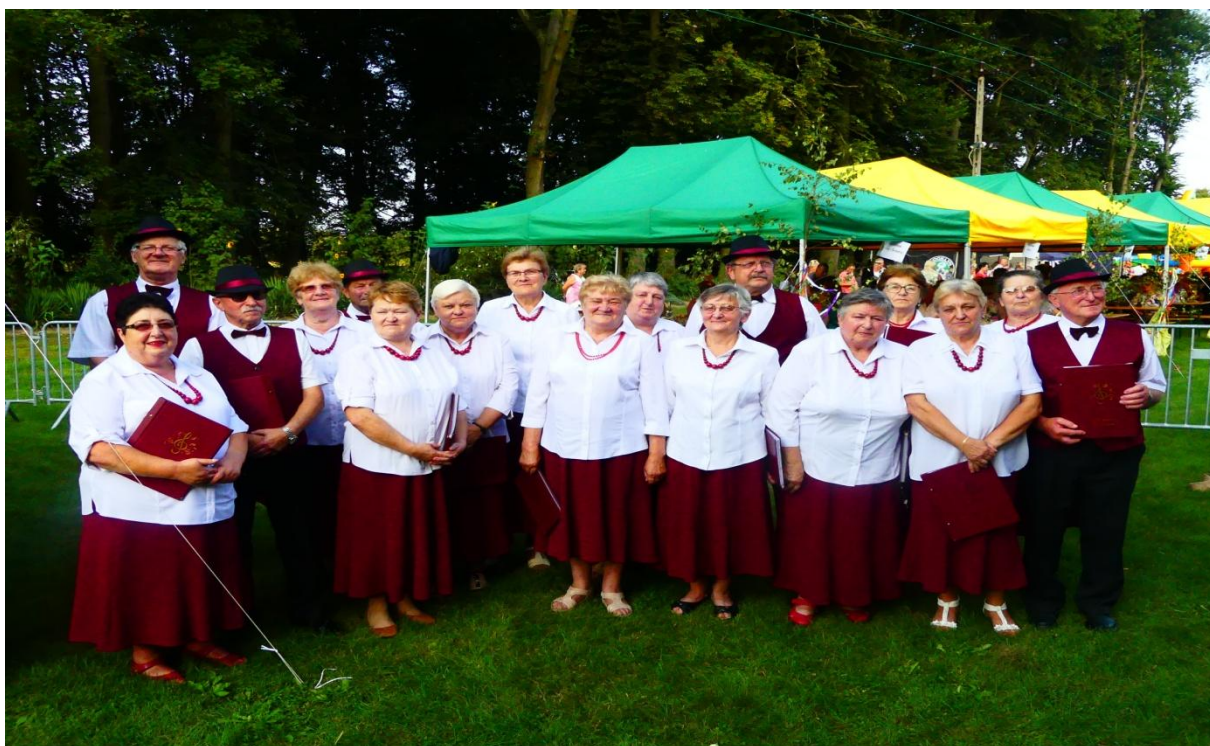
Klub Seniora Radostowianie.