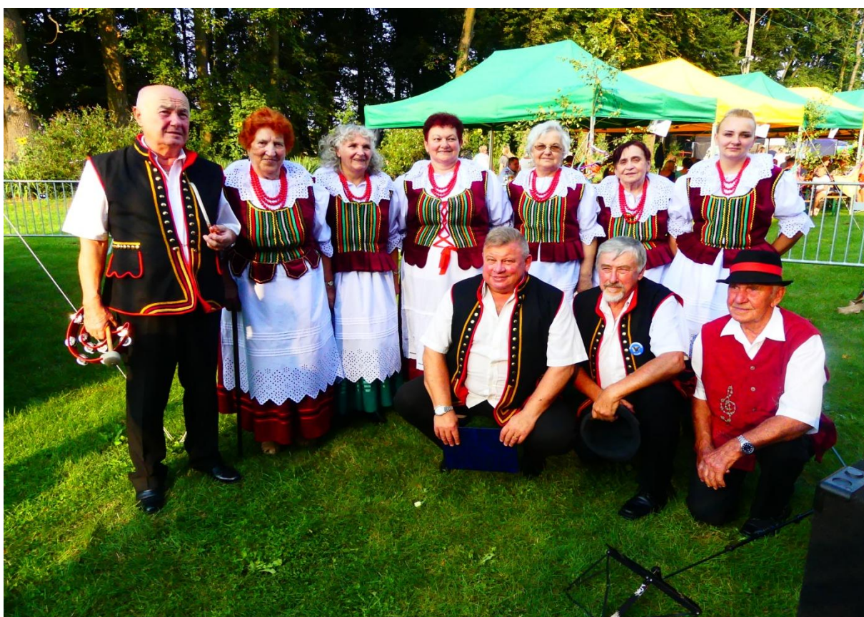
Zespół folklorystyczny Cisowianki.