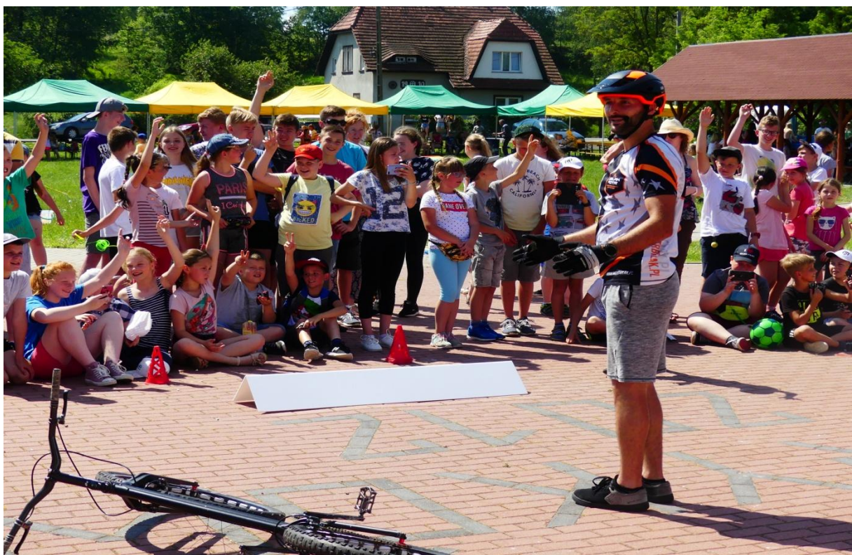
Gminny Dzień Dziecka.